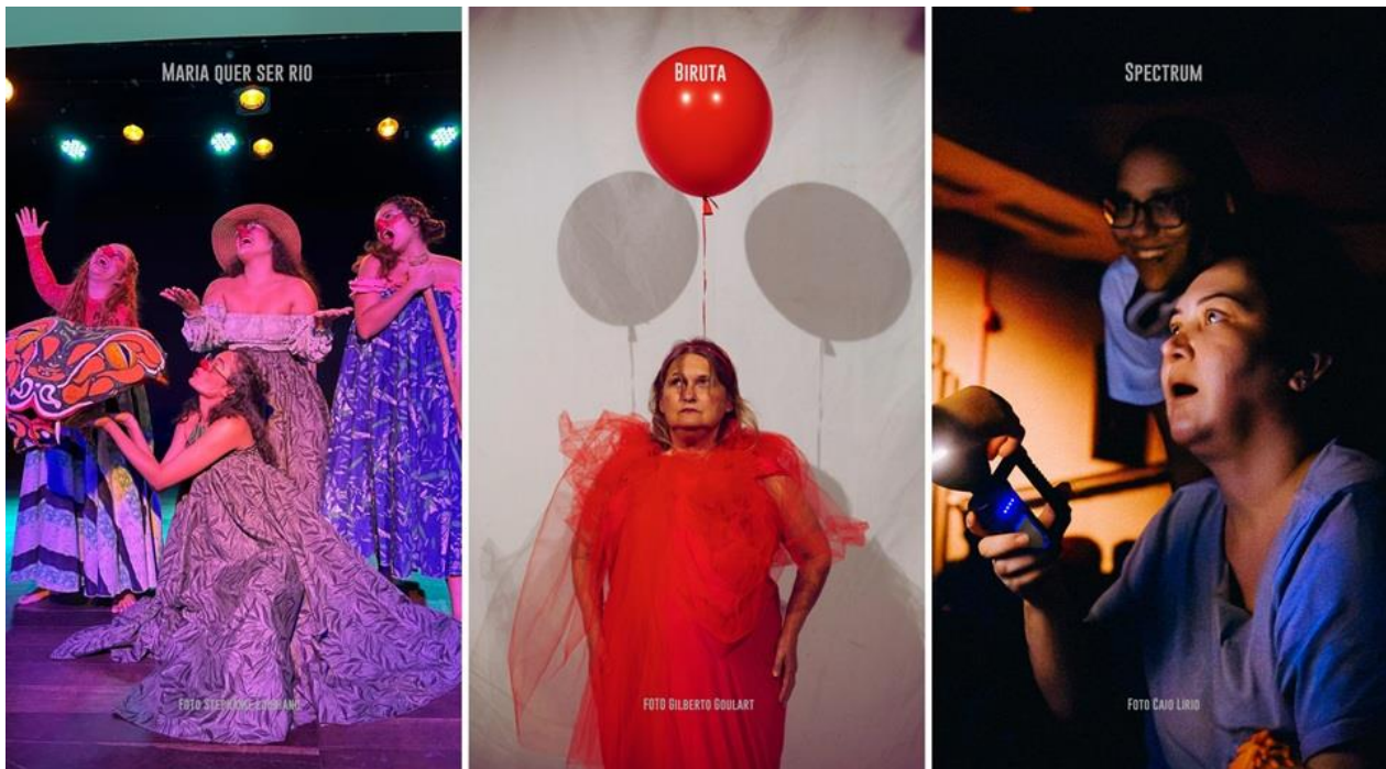
Espectáculos infantis e para a família programados na 5ª edição do Festival Acessa BH

A montagem “Maria quer ser rio” , da Coletiva de Palhaças (AM) , narra a história de Mariazinha, uma menina com baixa visão que vive em uma casa flutuante e descobre o mundo encantado da ancestralidade amazônica. O grupo atua nas interseções entre palhaçaria, feminismo, ancestralidade e acessibilidade. Criam experiências cênicas e formativas voltadas a públicos diversos, com atenção especial a mulheres negras, indígenas, LGBTQIA+ e pessoas com deficiência. Sua pesquisa amplia os horizontes da comicidade no Norte do país, incorporando perspectivas como a “cosmocegueira” e práticas anticapacitistas no fazer teatral.