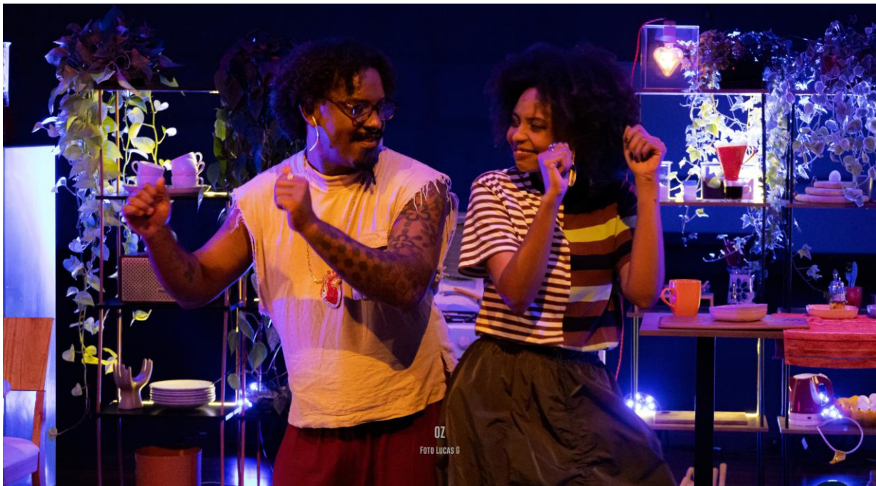
Foto - Cena de "OZ", espetáculo bilíngue encenado em Libras e em português

O espetáculo "Os Irmãos Karamázov" , que será apresentado no dia 12 de setembro, sexta-feira, às 20h, no Teatro do Centro Cultural Unimed-BH Minas , é estrelado e dirigido por Caio Blat, ao lado de Marina Vianna, e marca a primeira adaptação teatral de Os Irmãos Karamázov no Brasil.